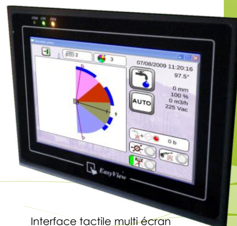
Interface tactile multi écran côté pivot (ou rampe)