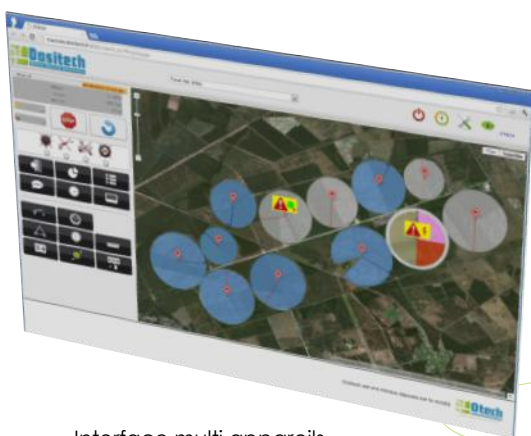
Interface multi appareils côté ordinateur

Dositech permet de gérer un pivot ou une rampe frontale fonctionnant sur 10 secteurs maximum, dont les doses d'eau à apporter par passage sont différentes. Le Dositech permet la surveillance et la programmation à distance de vos appareils connectés au réseau GPRS.